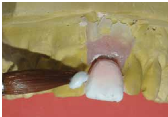
Figura 13 - Aplicação da cerâmica diretamente sobre o componente.