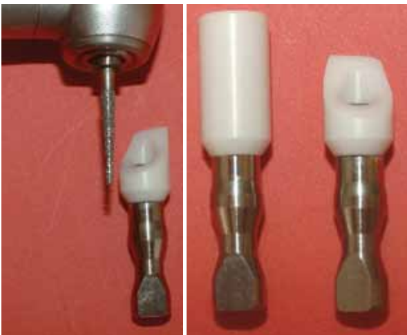
Figura 3 - Acabamento com pontas diamantadas.