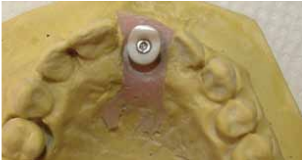
Figura 11 - Aspecto do preparo do componente.