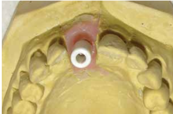
Figura 1 - Pilar cerâmico posicionado no modelo de trabalho.