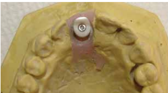
Figura 4 - Demonstração do componente original e o preparo elaborado.