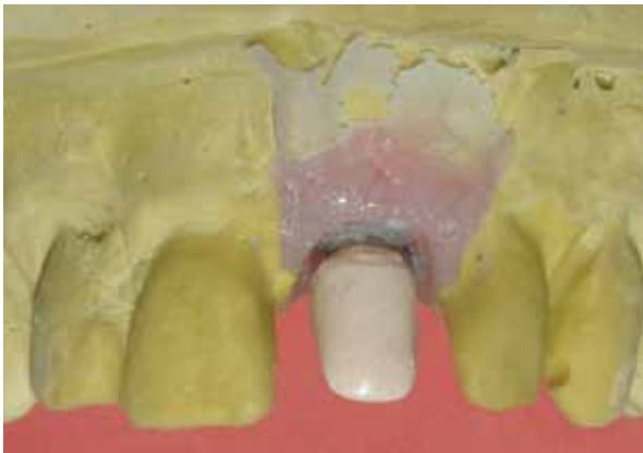
Figura 12 - Componente após a aplicação do agente de união e opaco.