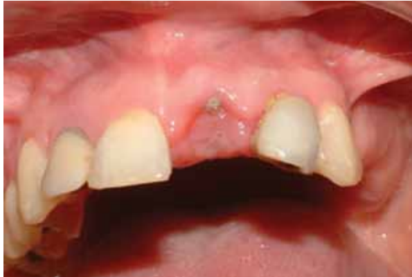
Fig. 17 - Aspecto gengival após 7 dias.

Após o período de 3 meses, para a osseointegra-