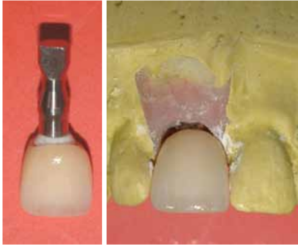
Figuras 8, 9 e 10 - Aspecto da coroa após a aplicação da cerâmica.