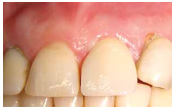
Figura 22: Aspecto clínico da coroa instalada, onde podemos observar a boa coloração do tecido gengival.

ser radiopaco, podendo ser avaliada sua adaptação sobre o implante (figura 21).