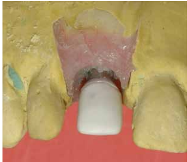
Figura 7 - Casquete de In Ceram posicionado sobre o componente.