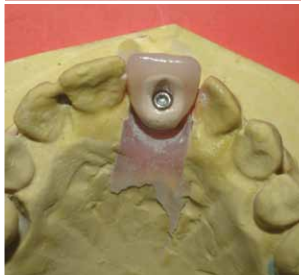
Figuras 15 e 16 - Aspecto do elemento dental acabado por vestibular e palatino, respectivamente.