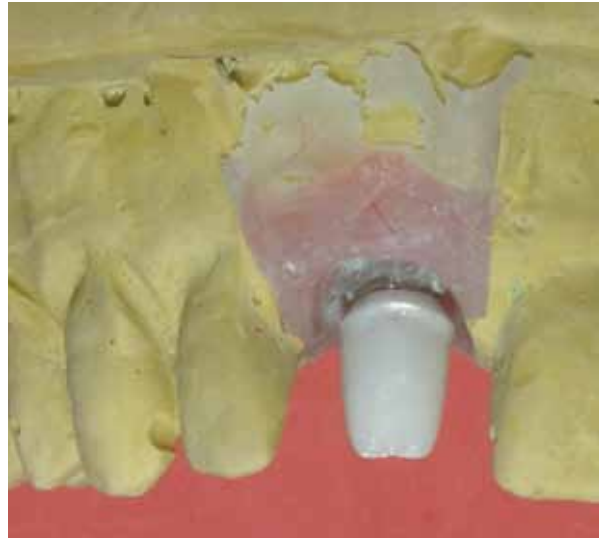
Figuras 5 e 6 - Imagens do componente preparado posicionado no modelo de trabalho.