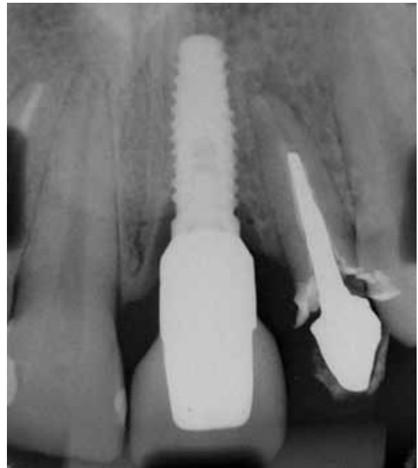
Figura 21 - Radiografia após a instalação da coroa, com seta demonstrando a possibilidade de verificar a adaptação da peça sobre o implante.