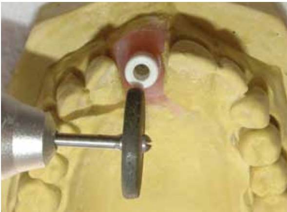
Figura 2 - Desgaste do pilar com roda de diamante.