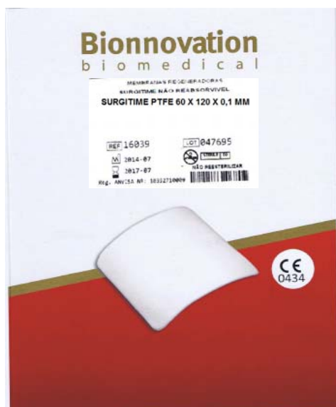
Embalagem final Bionnovation: caixa em papel cartão