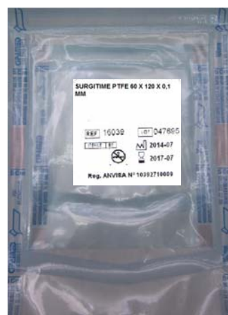
Embalagem primária e secundária: Envelope termo selante identificado