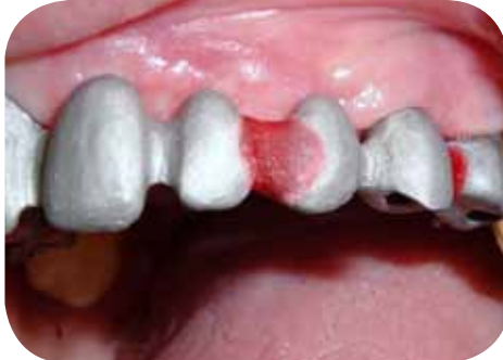
Vista direita da estrutura metálica