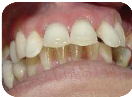
Deslocamento dos incisivos