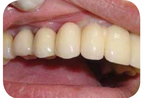
Vista direita da prótese