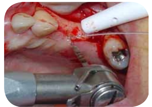
Perfuração com fresa lança