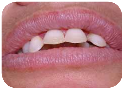
Mordida profunda e ausência de selamento labial