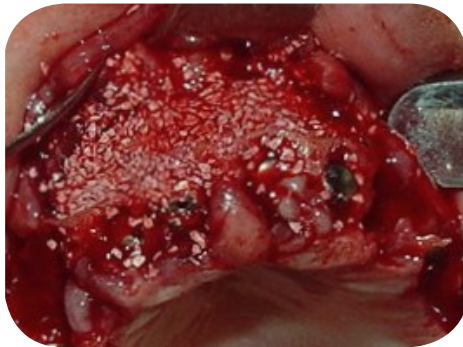
Enxerto com hidroxiapatita