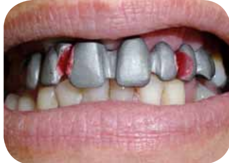
Estrutura metálica, observar posição de oclusão