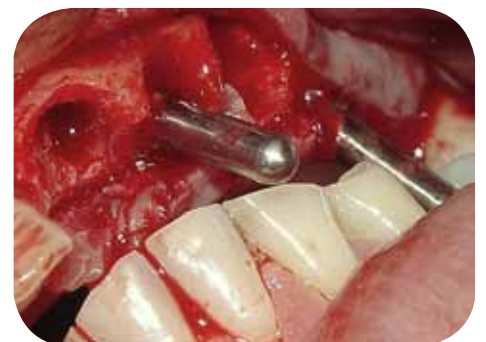
Observação da oclusão com pino guia