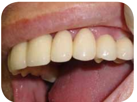
Lado esquerdo da prótese