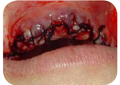
Aspecto final da regularização do rebordo