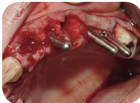
Exodontias e posicionadores de implantes