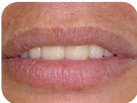
Final da reabilitação